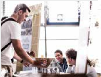
Projektpräsentation: Schüler präsentieren ein selbst gebautes Architekturmodell