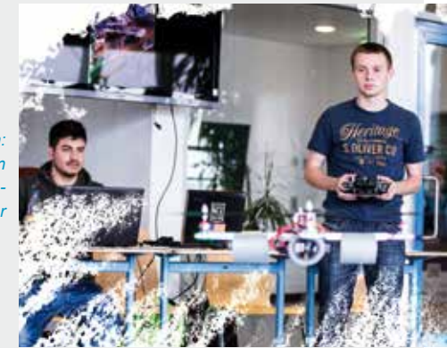
Projektpräsentation: Schüler präsentieren einen selbst hergestellten Quadropters

Der Abschluss eröffnet die Möglichkeit – unabhängig von der gewählten Fachrichtung und dem Schwerpunkt – an allen Fachhochschulen bzw. Hochschulen in allen Fachrichtungen zu studieren und Abschlüsse wie Bachelor oder aufbauend Master zu erreichen.